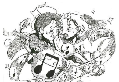
《合唱祭スローガン》