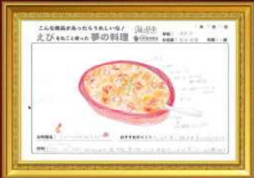
エビもれごとクリームお寿司 藍物 明愛さん(11歳)