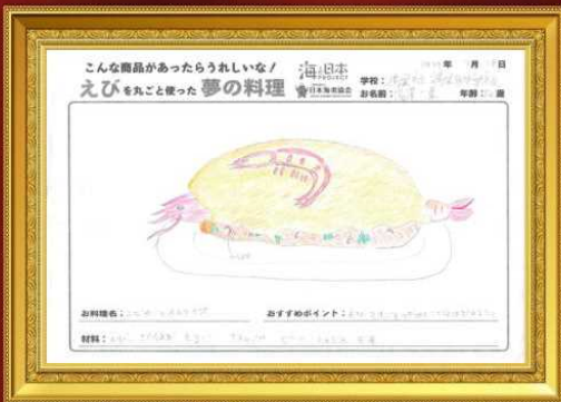
エビもれごとオムライス 湯澤 一葉さん(12歳)