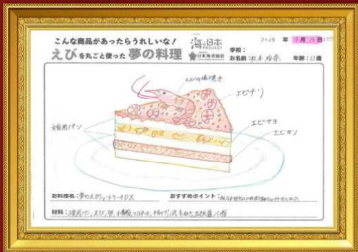
夢のえびショートケーキDX 秋本 玲奈さん(13歳)